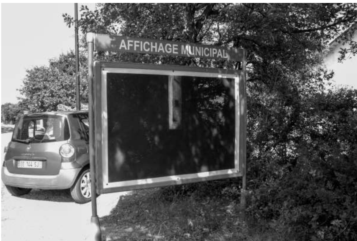
MC de BEYSSAC, dessins périssables, http://www.mcconilhdebeyssac.com/