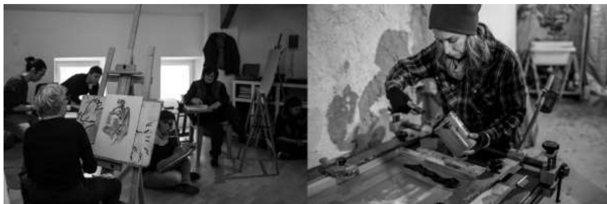
Ateliers réalisés courant 2018