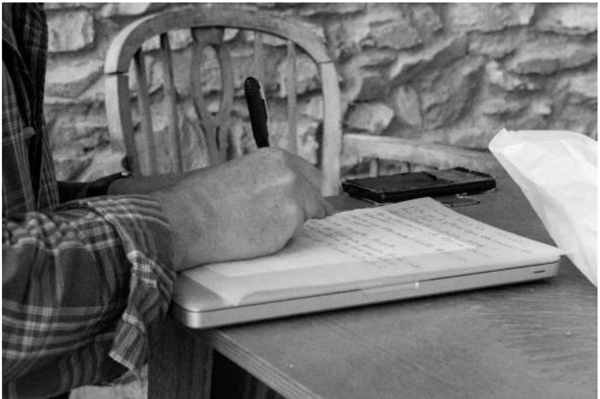
Alain Ubaldi, auteur/Dramaturge/Metteur en scène, une expérimentation hors plateau https://www.cie-kapitalistic-interrelation-theatre.com/