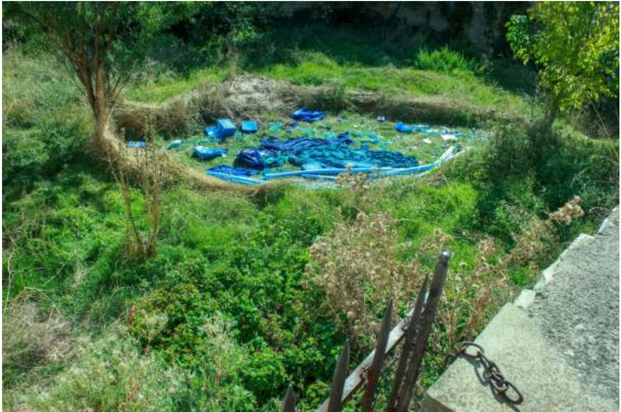
ALICE CUENOT, BLEU-CREU