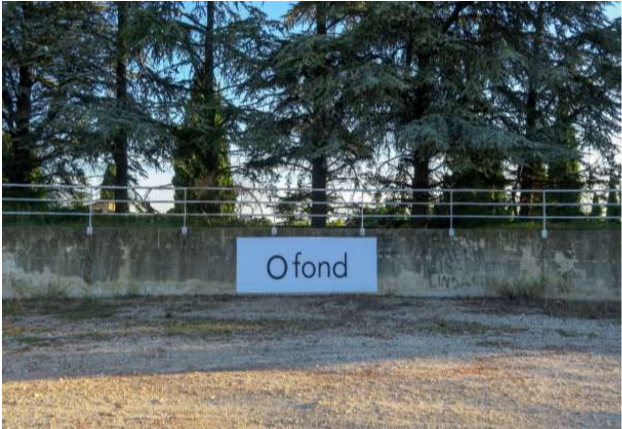
FLAVIE L.T, sculptures installations urbaines https://www.flavielt.com