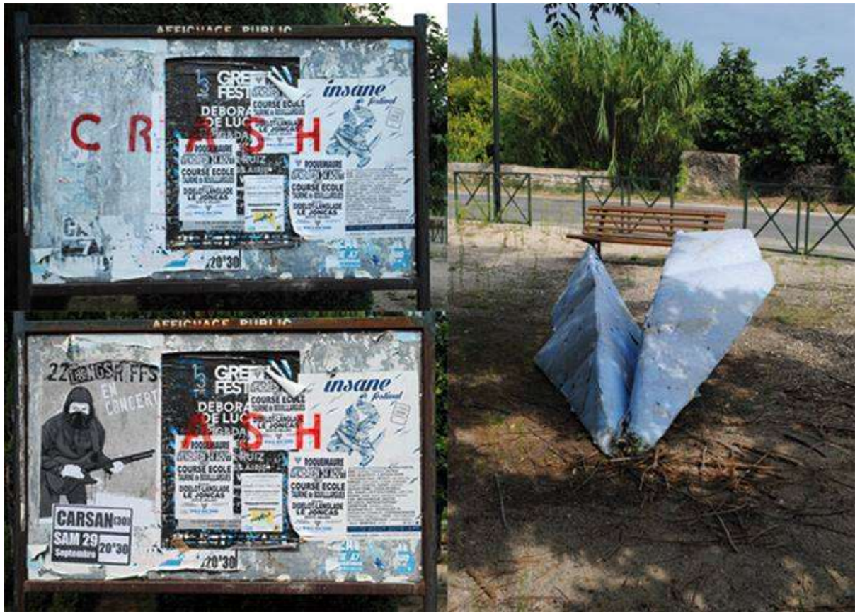
FLORENCE MIROL, sérigraphies urbaines, https://www.florencemirol.com