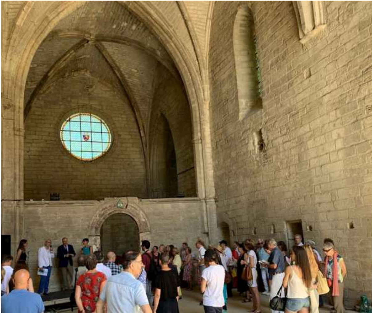
Vernissage à la Chartreuse le 6 Juillet