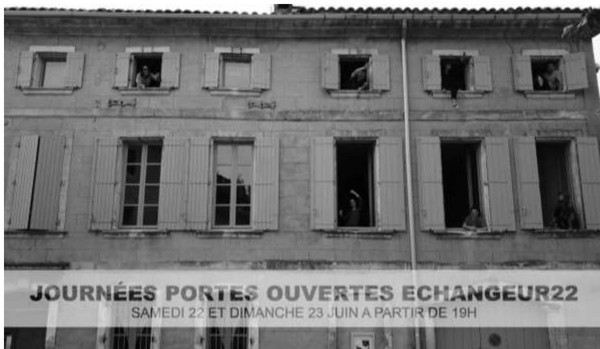
Journée Portes ouvertes

jours portes ouvertes + stage performance